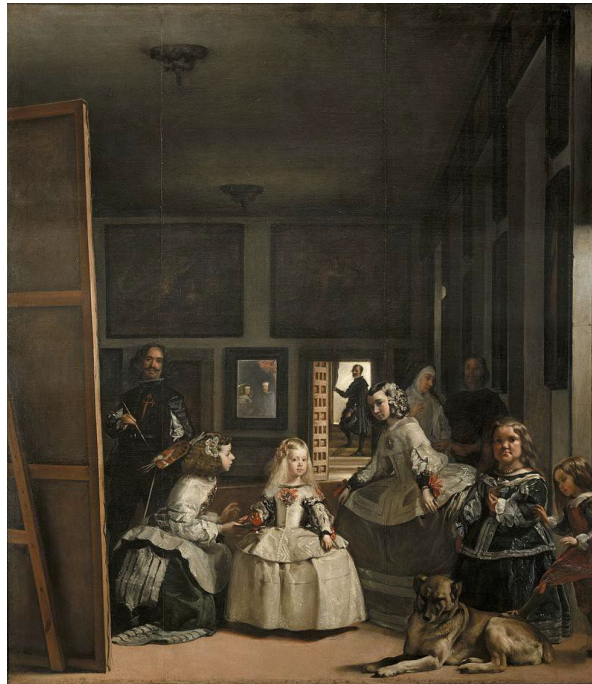
Figura 5. Diego Velázquez. Las meninas (1656), Galería online, Museo del Prado, Madrid, España. Dominio público. (Velázquez 1656).

Conflicto de intereses: El autor declara que no hay conflicto de intereses.