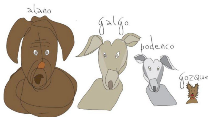
Figura 4. Tamara Schneider, Dog breeds in Don Quixote . © 2017 Tamara Schneider. Usado con permiso.

Si el perro hinchado representa la Parte I, un perro golpeado representa la Parte II. En la segunda historia, un loco que lanza piedras pesadas sobre las cabezas de los perros recibe una fuerte paliza por parte del dueño de uno de esos animales, un lebrél o podenco, un pariente más pequeño del galgo. Cervantes entrega la moraleja: “Quizá de esta suerte [es decir, una fuerte paliza] le podrá acontecer a este historiador, que no se atreverá a soltar más la presa de su ingenio en libros que, en siendo malos, son más duros que las peñas” (Cervantes 2015, p. 545). La segunda historia también menciona brevemente otras dos razas de perros: mastines o alanos y terriers o gozques (ver Figura 4). Temiendo otra paliza, el loco confunde a todos los perros con podencos, y así se abstiene de arrojar piedras sobre cualquier perro.