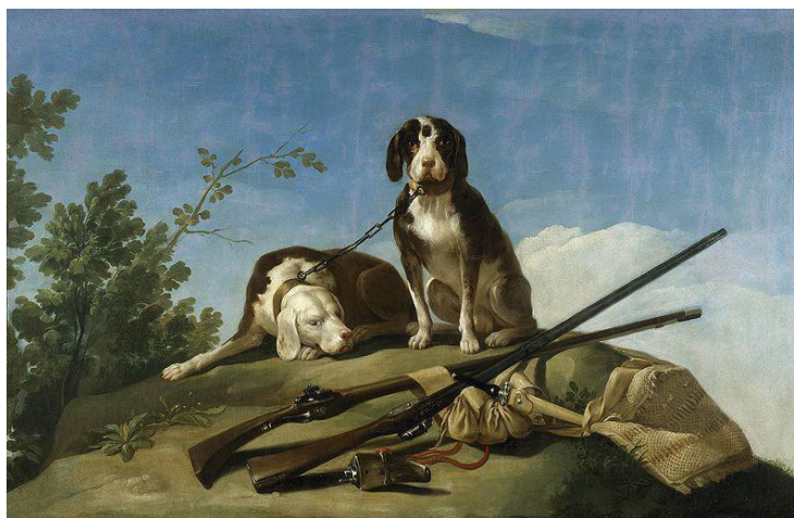
Figura 2. Francisco de Goya, Perros y útiles de caza o Perros en trailla (1775). Óleo en canvas. 112 × 174 cm. Museo del Prado (Madrid, España) Dominio público (Goya 1775).

Basándonos en la reacción a los perros de caza, podemos reconsiderar la relación de don Quijote con su propio galgo. Al principio de la novela, se le presenta como un aficionado a la caza (“amigo de la caza”) que luego, al leer cuentos de caballerías, “olvidó casi de todo punto el ejercicio de la caza” (Cervantes 2015, p. 28). Al comienzo del Capítulo 2, deja atrás su vida anterior, incluido su perro y el ejercicio de la caza. Hacia el final de la novela, la aparición de galgos que actúan en la violenta capacidad de los perros de caza resulta profundamente inquietante. Con esta transformación personal, podemos descubrir una “crítica de la caza. . . en consonancia con los humanistas que aborrecen la crueldad y el exceso de este pasatiempo aristocrático” (Scham 2014, p. 108).