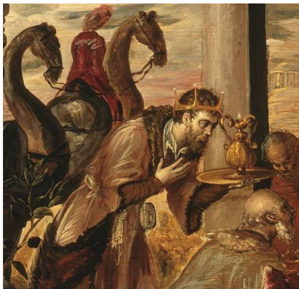
Figura 1. Detalle de El Greco, Adoración de los Reyes Magos (1568), Museo Soumaya, Ciudad de México. Dominio público (Greco 1568).

[Cervantes] veía sus escenas y los actores en ellas en su propia imaginación antes de plasmarlas en el papel, al igual que El Greco [ver Figura 1], quien hizo pequeños modelos de sus figuras en arcilla antes de pintarlas. (Bell 1947, pág. 101)